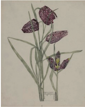
図4 植物画「フリチラリア」