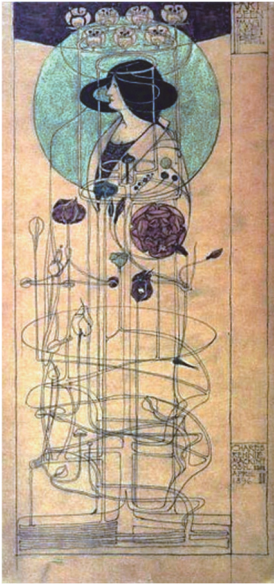
図1 初期水彩画 「見られる部分、 想像される部分」