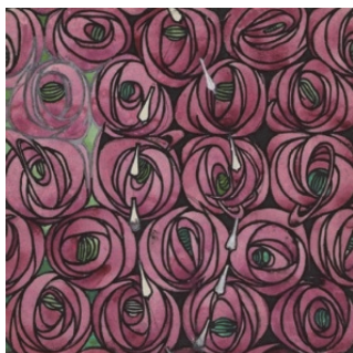
図7 テキスタイルデザイン 「バラと涙滴」