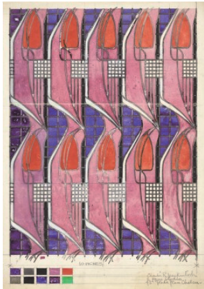
図5 テキスタイルデザイン 「チューリップと格子」